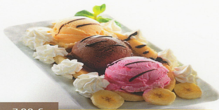
Copa Jijona Helado de turrón con trocitos de turrón